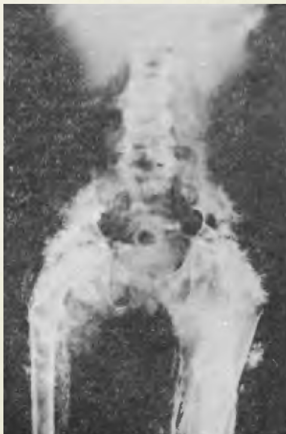
Figura 4. "Impresionante calcinosis en los músculos de cintura coxofemoral, que contrasta con la porosis ósea".