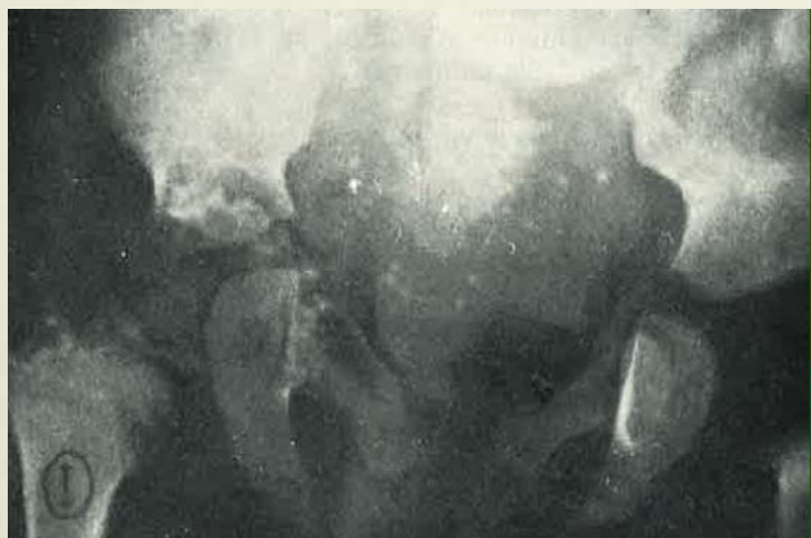
Figura 2. Paciente núm. 1. Múltiples calcificaciones puntiformes en la región sacro-coxígea. Profundas alteraciones en la epífisis femoral izquierda.